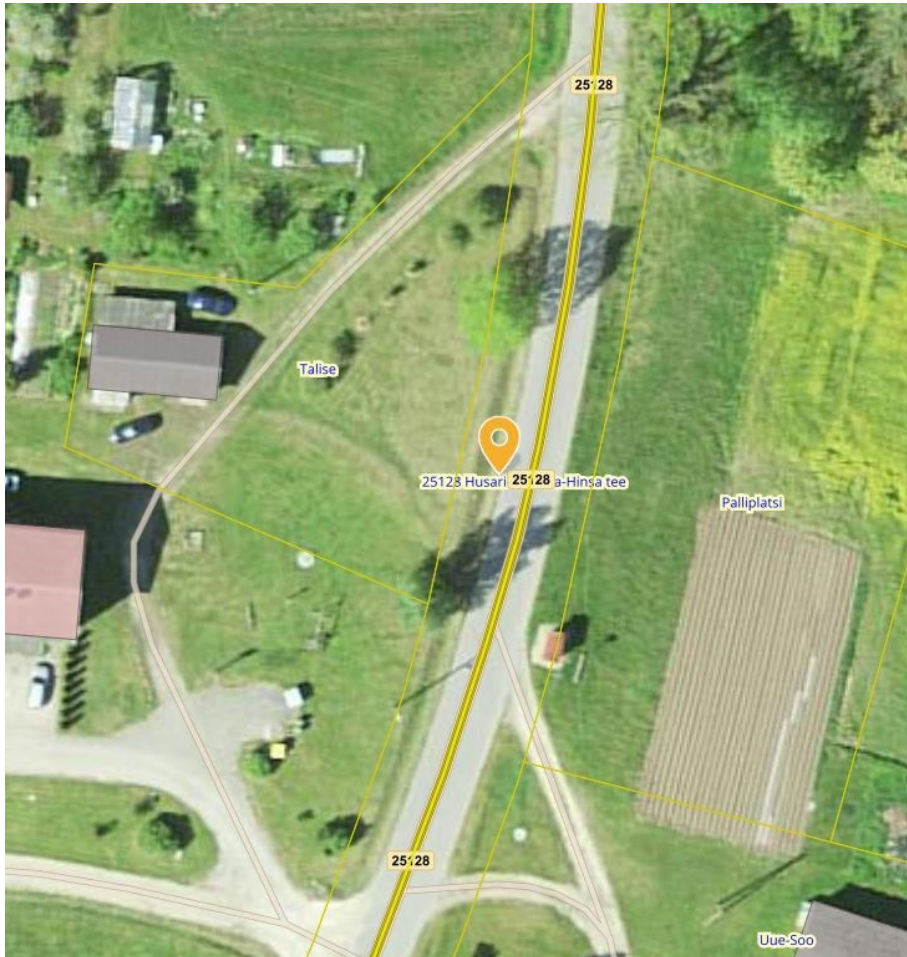
Joonis 3. Bussipeatus riigitee 25128 km 4,218 (paremal), väljavõtte Maa-ameti geoportaalist

Me ei võta endale kohustusi seoses uute bussipeatuste rajamisega, sh peatusetaskute, peenralaienduste, platvormide, istepinkide vms ehitamine. Vajadusel tuleb sellised tööd finantseerida kohalikul omavalitsusel.